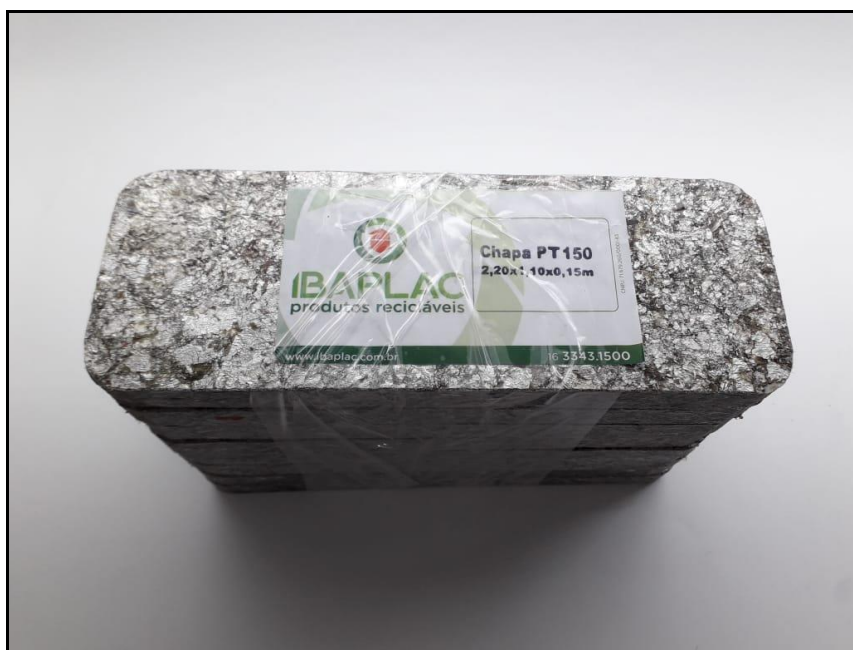
Figura 1 - Imagem da Amostra AFK191686.