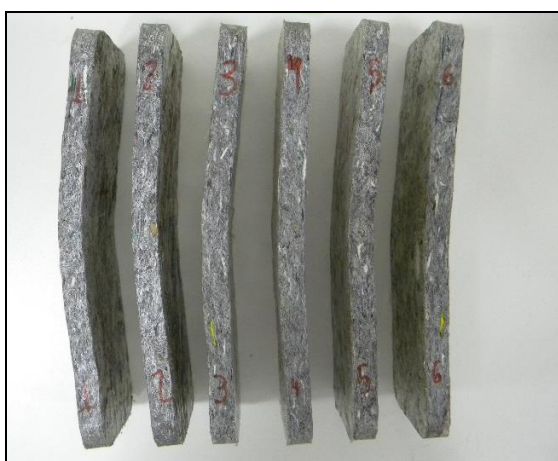
Figura 3 – Corpos de prova da amostra AFK191686.

A figura abaixo apresenta uma imagem dos corpos de prova da amostra analisada após a realização do ensaio de Flexão.